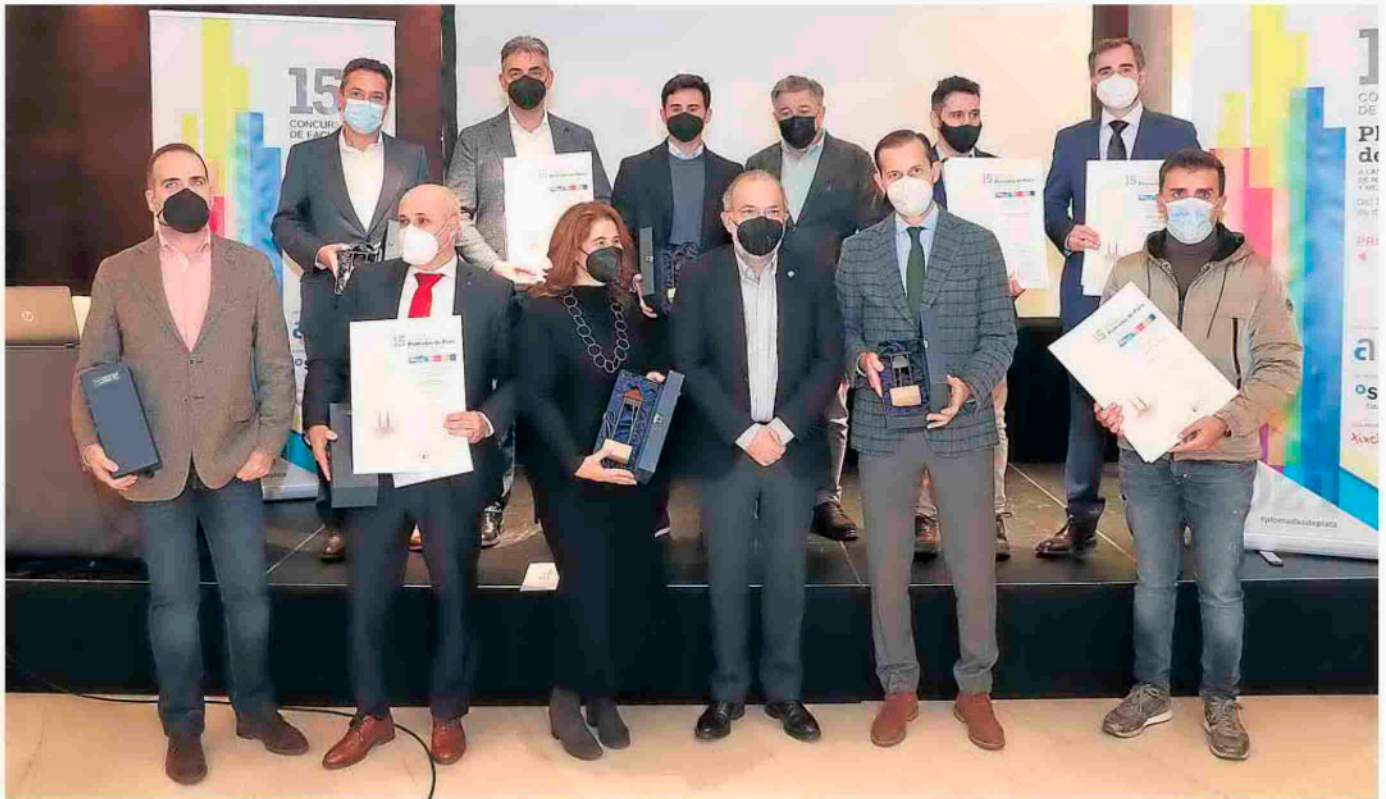
Foto de familia de los premiados, tras la entrega de premios de ayer en el hotel NH de Gijón.