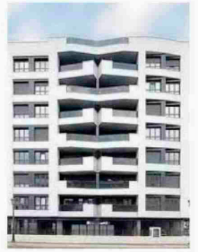
Plomada Popular nueva planta