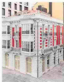
Diploma de honor (tercera)