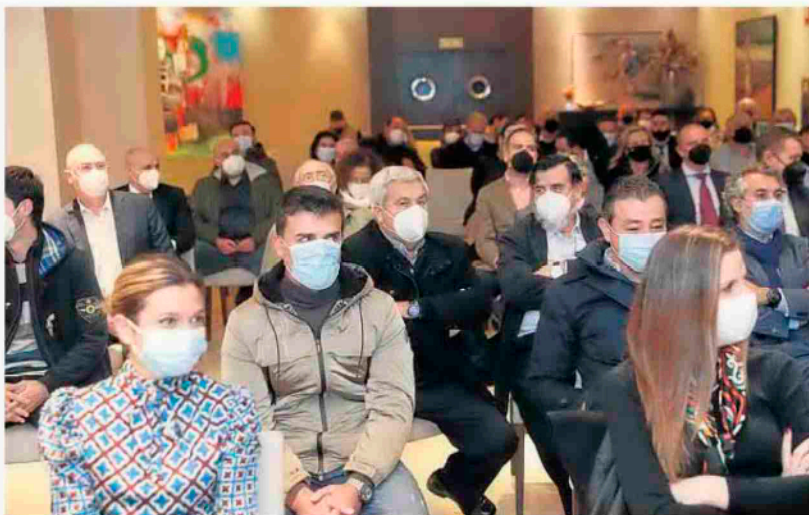
El público aplaudió a las iniciativas que está llevando a cabo el sector de la construcción.

GIJÓN. El sector de la construcción vivió ayer, en Gijón, su noche de gala, con la entrega de los premios Plomadas de Plata, que reconocen las mejores fachadas de nueva construcción y mejor rehabilitadas, en esta ocasión, desde el 1 de enero de 2019. Esta entrega de galardones, convocados por la Confederación Asturiana de la Construcción Asprocon con el patrocinio del Banco Sabadell, dejó patente, durante la celebración de su decimoquinta edición, la calidad constructora de la que puede presumir el Principado. Lo hizo al tiempo que repartía sus galardones, entre cinco puntos de nuestra geografía: Gijón, Oviedo, Avilés, Lugones y Muros de Nalón.