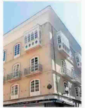
Popular fachada rehabilitada

Edificio: Casa Álvarez Mendoza. Situación: calle Marqués de Casa Valdés, Gijón. Constructor: Goncesco Grupo S.L. y Asprusa.