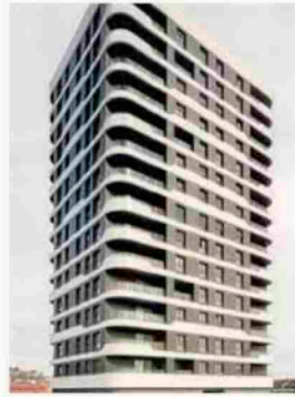
Diploma de honor (segunda)